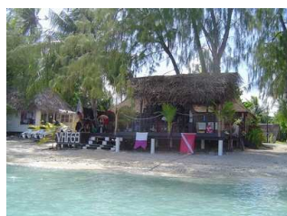
Le club au bord du lagon