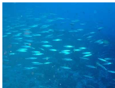
Banc de fusiliers