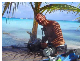
Les préparatifs photos