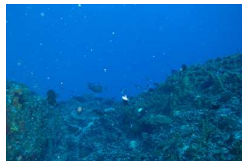
Vue de la passe

Pendant toute la traversée, nous choisissons la meilleure position aquadynamique afin d'effectuer des prises de vitesse. Nous laissons ainsi défilier le paysage lunaire pour nous retrouver quelques minutes plus tard dans le calme lagonaire. Coraux, tortues, famille de Napoléons et tous les poissons coralliens sont présents pour terminer avec nous cette folle équipée.