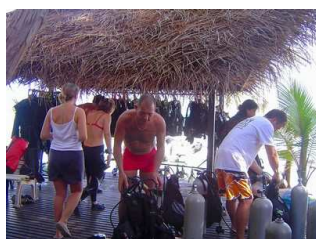
Les préparatifs matériels