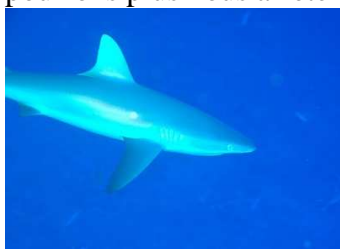
Requin gris -40m

Arrivés sur place, les requins gris décrivent de larges cercles, ils nous attendent. Alors nous descendons sur - 40 m afin de leur serrer la nageoire. Nous passons quelques minutes avec eux tout en nous dirigeant vers le courant de la passe rentrante. Une fois engagés dans le courant, nous ne pouvons plus nous arrêter.