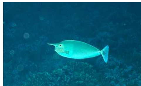
Nason à rostre court max 60 cm