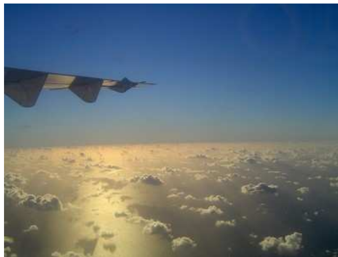
Arofa (salut) Rangiroa