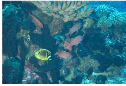
Chaetodon raton laveur (jaune) max 20cm