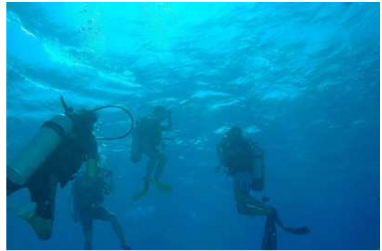
La folle équipée remonte la tête pleine de souvenirs