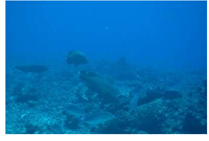
famille de 4 Napoléons

Un regard rapide sur nos manomètres et il est temps de faire nos paliers de décompression. Notre moniteur sort un parachute qui va remonter à la surface. Notre bateau va ainsi nous repérer et venir nous rechercher. Il est 17h30, le soleil se couche et déjà toutes les images et ces belles rencontres sont du domaine du souvenir, que nous prenons plaisir à partager.