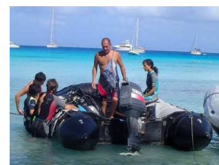
Prêt pour le départ

Pour accéder au site de plongée, nous devons naviguer 10 mn en zodiac et traverser la passe avec des vagues de plus d'un mètre de haut qui venaient s'écraser dans le bateau. Plus besoin de visiter le Texas pour ses rodéos, Rangiroa le remplace. Notre navigateur polynésien sonde le courant et le vent et nous place idéalement pour la mise à l'eau. 3 toru – 2 piti – 1 hōe - go nous voilà précipités sous les vagues et dans le grand bleu. Moment de silence, tout le monde est OK et nous descendons sur un fond de 20 m en direction de la passe (voir le tracé rouge sur la carte).