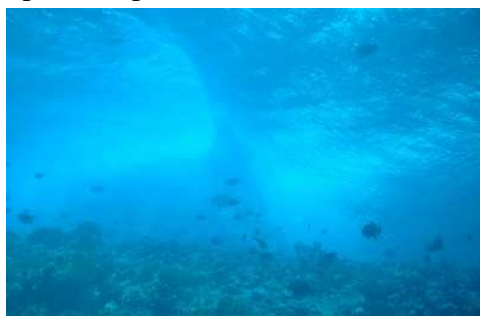
Vague vue de dessous