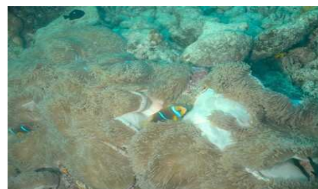
Poisson clown dans anémone qui surveille ses œufs