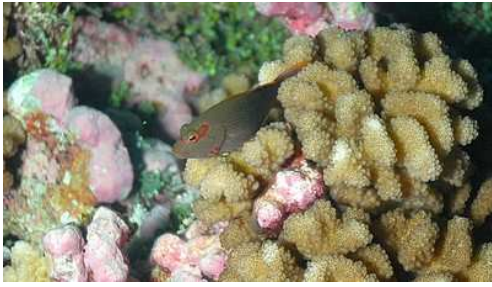
poisson faucon max 14 cm