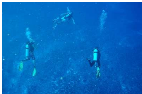
Formation de vol

Nous quittons cet endroit pour nous engager dans la passe qui est désertique. Les courants violents empêchent toute formation de corail mais la sensation d'être emportés par cette force herculéenne nous donne la sensation de voler pendant plus de 2 km.