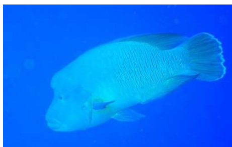
Napoléon max 230 cm et 200 kg

Pendant toute la traversée, nous choisissons la meilleure position aquadynamique afin d'effectuer des prises de vitesse. Nous laissons ainsi défilier le paysage lunaire pour nous retrouver quelques minutes plus tard dans le calme lagonaire. Coraux, tortues, famille de Napoléons et tous les poissons coralliens sont présents pour terminer avec nous cette folle équipée.